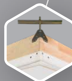
Cajón de madera con moldura metálica y soportes de montaje rápido.