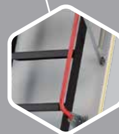
Trampa termoaislante y pasamanos.